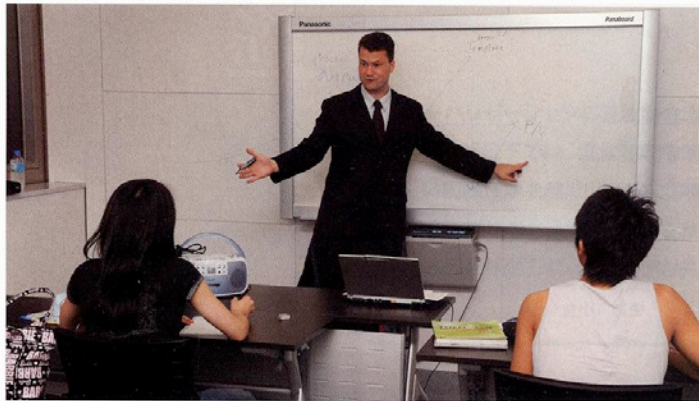
この日3時間5分に及んだ英語の授業。内容はハードだが、講師は頻りにジョークを飛ばし、終始リラックスした雰囲気だった

講師は「米国のトップ級大学では入学選考時も実際の授業でも、深い思考力や感性、意見を持つ学生が求められる。こうした双方向型授業への準備は不可欠だ」と授業方針を説明する。授業を終えた2人は「メチャク